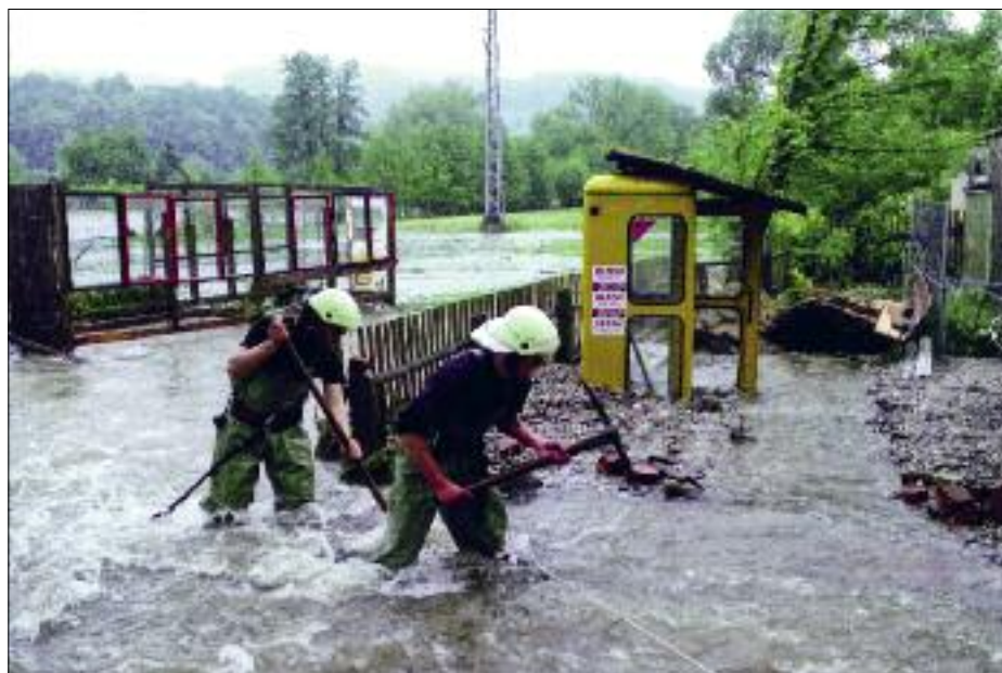
Kameraden beim Einsatz in der Nähe der Dorfstraße