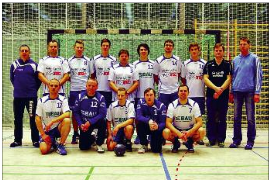
Die 2. Männermannschaft des VfB Flöha kämpft in der Handball-Kreisliga um den Titel.